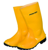
Bottes 800 bar