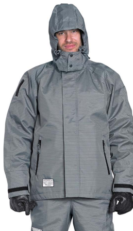
Veste à capuche