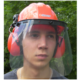
Casque Protect complet

Réf : 89990041 Réglables, Rotation 360° Mousse mémoire de forme (Norme EN352-3, SNR 29dB)