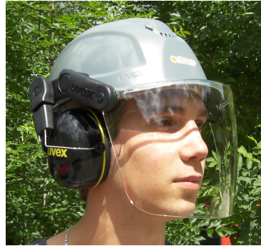
Casque Xtreme nu

Réf : 89990038 (visière, coquilles) (Norme EN397)