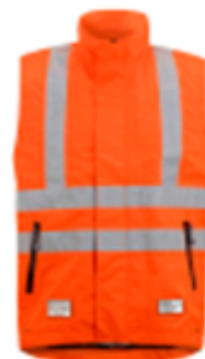
Veste ss manches