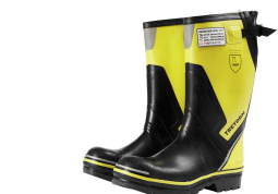
Bottes 500 bar